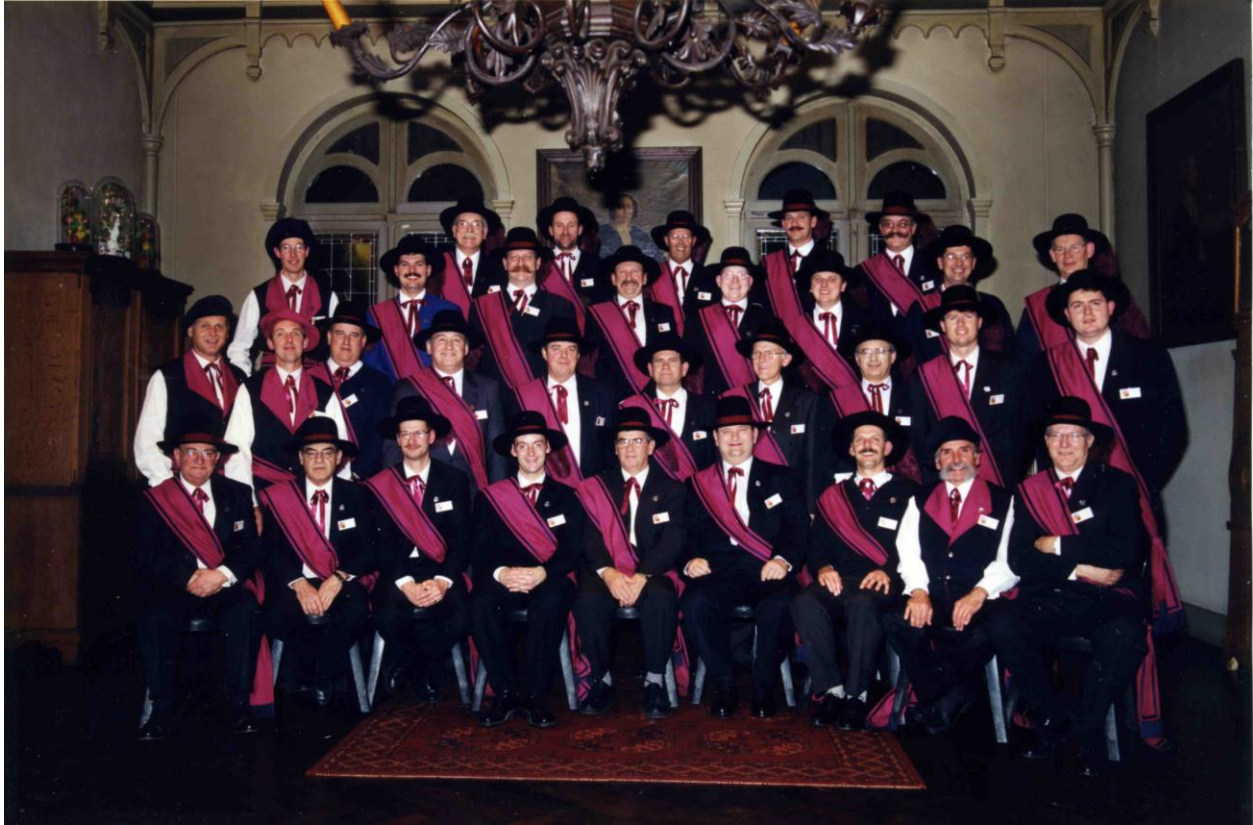
Groepsportret gilde Sint-Barbara en Sint-Joris bij de heropricting op 4 december 1996 in de ridderzaal van kasteel Stapelen.