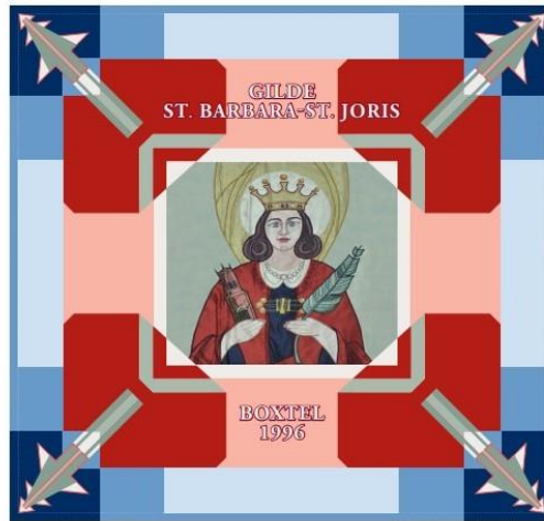
Boxtels gildevaandel met afbeelding Sint-Barbara