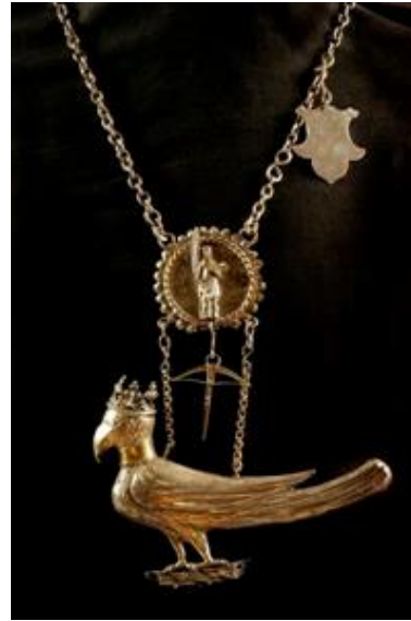
De collectie van het Noordbrabants Museum in 's-Hertogenbosch omvat onder meer twee zogeheten koningsbreuken van het Sint-Barbaragilde uit Boxtel. (Foto: Paul Deelen).