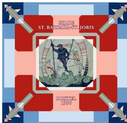
Boxtels gildevaandel met afbeelding Sint-Joris

Gildepatroon Joris of Georgius was een vermaard krijgsman uit de derde eeuw en volgens overlevering afkomstig uit Klein-Azië. Hij is omstreeks 303 onder de Romeinse keizer Diocletianus voor zijn geloof gestorven. Joris is de beschermheilige van de voetbooggilden.