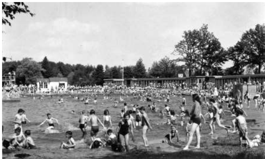
* Drukke in openluchtbad Molenwijk