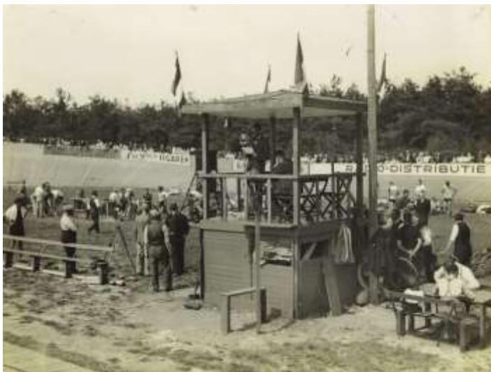
* Houten wielersbaan 1934-1941

Het was in de jaren dertig dat ook in Boxtel sprake was van een ernstige economische crisis met veel werklozen en slechte sociale voorzieningen. Er was armoede, vooral onder de werkloze arbeiders. Het instituut "werkverschaffing" trachtte door het realiseren van bepaalde projecten voor velen de ergste nood te lenigen. In dit kader verrees het park Molenwijk met daarin onder andere een wielersbaan.