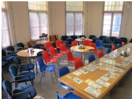
Publieksruimte voor max. 65 personen

De publieksruimte is tegen een passende financiële vergoeding, ook op werkdagen, beschikbaar voor derden voor het geven van workshops, cursussen, studiedagen, bijeenkomsten, lezingen, enz. Er is een plafondbeamer, en een vast projectiescherm beschikbaar en ook van een geluidsinstallatie van goede kwaliteit kan gebruik worden gemaakt. Voorwaarde voor gebruik is dat de activiteit gerelateerd kan worden aan geschiedenis, kunst en cultuur. In 2015 is hiervan vele malen gebruik gemaakt zoals voor: