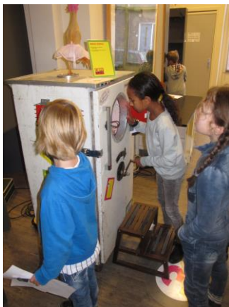
Educatieproject Copy-Paste voor basisschoolgroepen 5/6

De vaste expositie leent zich vooral voor educatieprojecten voor basisscholen en middelbaar onderwijs. In 2015 hebben we opnieuw het door Erfgoed Brabant ontwikkelde project 'Overgisteren' gedraaid voor de groepen 1/2 van alle basisscholen in Boxtel e.o. Daarnaast is in samenwerking met de Kunstbalie in Tilburg een educatieproject 'Copy-Paste' ingezet voor de groepen 5/6 van alle basisscholen in Boxtel e.o.