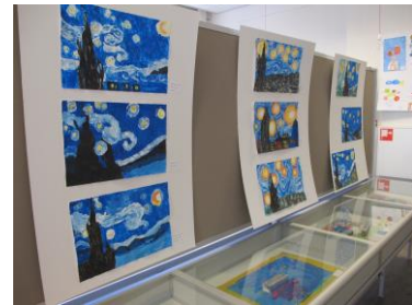
Vincent van Gogh week Angelaschool