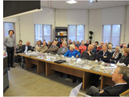
Lezing over 70 jaar Brabants Centrum

De lezingen worden altijd geprogrammeerd op een zondag van 11.15-13.00 uur. Gezien de grote opkomst een gouden formule gebleken, die ook in 2016 navolging gaat krijgen.