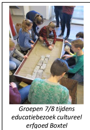
Groepen 7/8 tijdens educatiebezoek cultureel erfgoed Boxtel

De vaste expositie leent zich vooral voor educatieprojecten voor basisscholen en middelbaar onderwijs. In 2018 hebben we opnieuw het door Erfgoed Brabant ontwikkelde project 'Overgisteren' gedraaid voor de groepen 1/2 van basisscholen in Boxtel e.o. MUBO zelf heeft