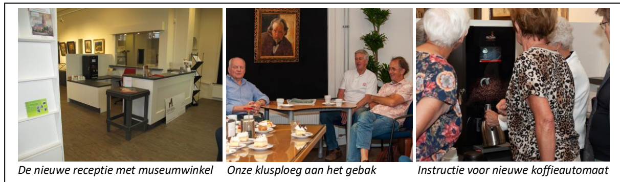
De nieuwe receptie met museumwinkel

Op verzoek van MUBO hebben 8 studenten van het Boxtelse SintLucas zich gebogen over een nieuwe opzet van de receptie en de ontvangstruimte. Het leverde 8 verrassende ontwerpen op, die in overleg met MUBO hebben geleid tot één definitief ontwerp. Het ontwerp voorziet in een modernere en meer toegankelijke balie/receptie met verbeterde horecafaciliteiten. In de ontvangstruimte zelf is tevens plaatsgemaakt voor een kleine museumwinkel en bibliotheek met documentatie over de Boxtelse geschiedenis. Met de hulp van onze klusploeg heeft Meubelmakerij Den Berg uit Liempde de receptie uitgevoerd en opgeleverd. Natuurlijk is de nieuwe receptie feestelijk ingewijd met alle vrijwilligers op 16 mei 2018. De ontvangstruimte is hiermee nog aantrekkelijker gemaakt voor activiteiten zoals lezingen, cursussen, vergaderingen, workshops en presentaties.