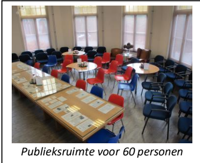
Publieksruimte voor 60 personen

De ontvangstruimte is tegen een passende financiële vergoeding, ook op werkdagen, beschikbaar voor derden voor het geven van workshops, cursussen, studiedagen, bijeenkomsten, lezingen, enz. Er is een plafondbeamer en een vast projectiescherm beschikbaar en ook van een geluidsinstallatie van goede kwaliteit kan gebruik worden gemaakt. Voorwaarde voor gebruik is dat de activiteit gerelateerd kan worden aan geschiedenis, kunst en cultuur. In 2018 is hiervan weer vele malen gebruik gemaakt zoals o.a.