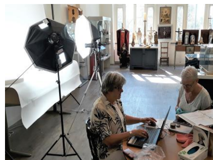
Werkplek met fotostudio Brabant Cloud

Ook in 2018 is men volop bezig geweest met het inventariseren, registreren en digitaliseren van alle museale objecten van MUBO. Dit betekent dat elk object zorgvuldige en uitvoering wordt beschreven en gefotografeerd. Belangrijkste doel is in beeld te krijgen van wat zich allemaal in de collectie van het museum bevindt, maar ook om het eenvoudiger te maken exposities samen te stellen van onderdelen van de collectie. Alle geïnventariseerde objecten worden ook opgenomen in de Brabant Cloud. Dit betekent dat de collectie van MUBO gedeeld wordt op internet en door iedereen kan worden geraadpleegd. Brabant Cloud is een digitale verzamelplaats voor het bewaren én delen van alle erfgoed informatie van de provincie Noord-Brabant, bijv. (museum)collecties, monumenten, personen, organisaties, verhalen, plaatsen en historische gebeurtenissen. De informatie wordt via Brabant Cloud voor iedereen toegankelijk gemaakt. Erfgoedinstellingen kunnen op deze manier eventueel ook collectieonderdelen uitwisselen.