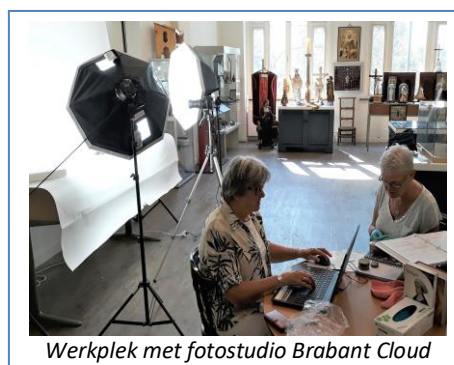
Werkplek met fotostudio Brabant Cloud

Ook in 2019 is men volop bezig geweest met het inventariseren, registreren en digitaliseren van alle museale objecten van MUBO. De collectiestukken uit de vaste expositie op zaal zijn nu allemaal geregistreerd. Een start is gemaakt met de objecten in depot. Dit betekent dat elk object zorgvuldige en uitvoering wordt beschreven en gefotografeerd. Belangrijkste doel is in beeld te krijgen van wat zich allemaal in de collectie van het museum bevindt, maar ook om het eenvoudiger te maken exposities samen te stellen met objecten uit de MUBO-collectie. Alle geïnventariseerde objecten worden ook opgenomen in de Brabant Cloud, een digitale verzamelplaats voor het bewaren én delen van alle erfgoed informatie van de provincie Noord-Brabant. De informatie wordt via Brabant Cloud voor iedereen toegankelijk gemaakt. Erfgoedinstellingen kunnen op deze manier ook objecten uit de collectie uitwisselen.