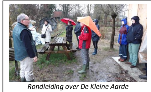
Rondleiding over De Kleine Aarde

Als dank en waardering voor alle inzet heeft het bestuur aan de lustrumviering ook een vrijwilligersuitje gekoppeld. Dat vond plaats op vrijdag 15 maart 2019 met dit keer een bezoek aan De Kleine Aarde in Boxtel. Na aankomst met gebak stond een presentatie op het programma over de geschiedenis van De Kleine Aarde met aansluitend een rondleiding over