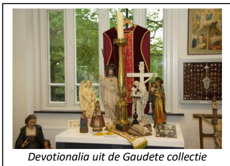
Devotionalia uit de Gaudete collectie

De vier eerdergenoemde collecties maken hiervan inmiddels onderdeel uit. De canon bestaat uit 49 vensters, die dekking geven aan de belangrijkste gebeurtenissen, personen, voorwerpen en kunstwerken uit de geschiedenis van Boxtel.