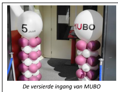
De versierde ingang van MUBO

In maart 2019 bestond MUBO 5 jaar. We hebben dit lustrum gevierd met een open dag op zondag 17 maart met activiteiten en attracties voor jong en oud. En ook muziek, hapjes en drankjes ontbraken niet. De dag stond in het teken van oud Hollandse ambachten en spelletjes. Het publiek kon genieten van demonstraties van maken van sigaren, weven op oude weefgetouwen, rietvlechten, quilten en vendelzwaaien. De kinderen konden zich uitleven met speurtochten, blikgooien, sjoelen, keistampen, en kijken naar poppenkastspel. Dit alles werd aan elkaar gepraat door de historische figuur Hendrik Verhees. De druk bezochte dag eindigde met de uitslag van een prijsvraag en de uitreiking van de prijs, bestaande uit vier kaartjes voor de Efteling, gewonnen door de twee jongste deelnemers.