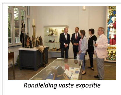
Rondleiding vaste expositie