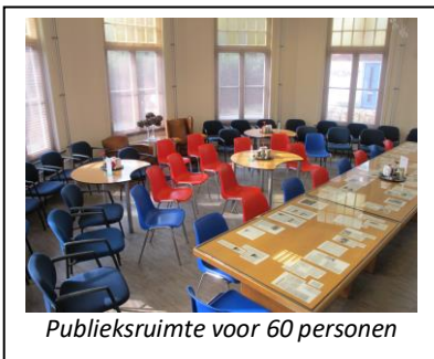
Publieksruimte voor 60 personen

De ontvangstruimte is tegen een passende financiële vergoeding, ook op werkdagen, beschikbaar voor derden voor het geven van workshops, cursussen, studiedagen, bijeenkomsten, lezingen, enz. Er is een plafondbeamer en een vast projectiescherm beschikbaar en ook van een geluidsinstallatie van goede kwaliteit kan gebruik worden gemaakt. Voorwaarde voor gebruik is dat de activiteit gerelateerd kan worden aan geschiedenis, kunst en cultuur. In 2019 is hiervan weer vele malen gebruik gemaakt zoals o.a.