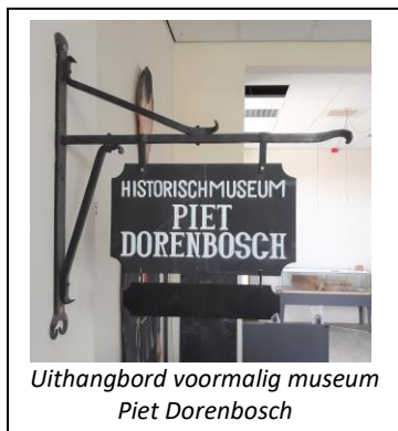
Uithangbord voormalig museum Piet Dorenbosch

De vier eerdergenoemde collecties maken hiervan nu onderdeel uit. De canon bestaat uit 49 vensters, die dekking geven aan de belangrijkste gebeurtenissen, personen, voorwerpen en kunstwerken uit de geschiedenis van Boxtel.