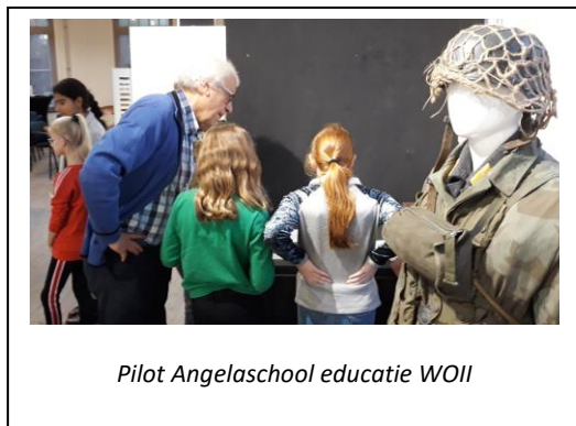
Pilot Angelaschool educatie WOII

De vaste expositie leent zich vooral voor educatieprojecten voor het basis- en voortgezet onderwijs. Door corona heeft de educatie in 2020 op een laag pitje gestaan. Slechts drie groepen 1/2 hebben in het begin van 2020 nog een bezoek kunnen brengen voor het door Erfgoed Brabant ontwikkelde project 'Overgisteren'. In totaal hebben 61 kinderen deelgenomen. Wel zijn we alvast gestart met het ontwikkelen en promoten van een educatieproject over Boxtel in de oorlogsjaren 1940-1944 voor de groepen 7/8 uit