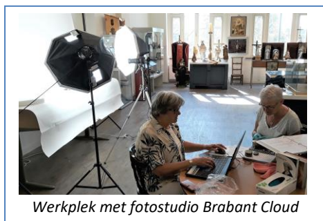
Werkplek met fotostudio Brabant Cloud

Ook in 2020 is men volop bezig geweest met het inventariseren, registreren en digitaliseren van alle museale objecten van MUBO. Na de registratie van de collectiestukken op zaal, zijn we nu bezig met de objecten in depot. Belangrijkste doel is overzicht van onze collectiestukken. Alle geregistreerde objecten worden opgenomen in de Brabant Cloud, een digitale verzamelplaats voor het bewaren én delen van alle erfgoedinformatie van de provincie Noord-Brabant. De