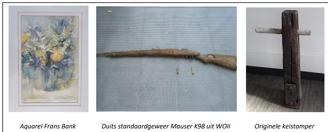
Aquarel Frans Bank