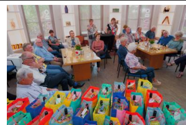
Bijeenkomst vrijwilligers ter gelegenheid van heropening vaste expositie 'De geschiedenis van Boxtel'

De ontvangstruimte is tegen een passende financiële vergoeding ook op werkdagen beschikbaar voor derden voor het geven van workshops, cursussen, studiedagen, bijeenkomsten, lezingen, enz. Er is een plafondbeamer, een vast projectiescherm en een geluidsinstallatie van goede kwaliteit beschikbaar. Voorwaarde voor gebruik is dat de activiteit gerelateerd kan worden aan geschiedenis, kunst en cultuur. In 2021 is hiervan door corona in beperkte mate gebruik gemaakt zoals voor muziekcursussen, fotoclub Boxtel en vergaderingen van het Vrouwengilde Boxtel.