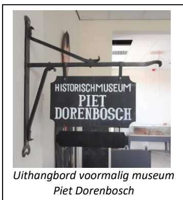
Uithangbord voormalig museum Piet Dorenbosch

en devotionalia van Gaudete. De culturele en maatschappelijke visie was om deze vier uiteenlopende collecties te integreren in één museum en er één verhaal van te maken. Gaandeweg is deze visie doorontwikkeld naar het vertellen van de geschiedenis van Boxtel vanaf de prehistorie tot heden door middel van de Canon van Boxtel.