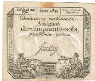
Assignaat Bataafse Republiek