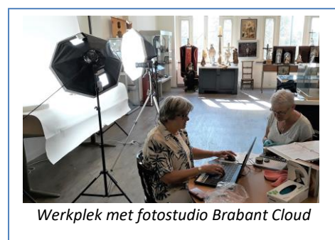
Werkplek met fotostudio Brabant Cloud

Ook in 2021 is men volop bezig geweest met het inventariseren, registreren en digitaliseren van alle museale objecten van MUBO. Na de registratie van de collectiestukken op zaal, zijn we nu bezig met de objecten in het depot. Belangrijkste doel is overzicht van onze collectiestukken. Alle geregistreerde objecten worden opgenomen in de Brabant Cloud, een digitale verzamelplaats voor het bewaren én delen van erfgoed informatie in de provincie Noord-Brabant.