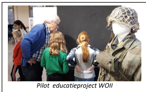
Pilot educatieproject WOII

De vaste expositie leent zich vooral voor educatieprojecten voor het basis- en voortgezet onderwijs. Zo is er het door Erfgoed Brabant ontwikkelde project 'Overgisteren' voor de groepen 1/2 van het basisonderwijs. Wegens corona hebben we in 2021 geen kinderen kunnen ontvangen. Wel zijn we gestart met het ontwikkelen en promoten van een educatieproject over Boxtel in de oorlogsjaren 1940-1944 voor de groepen 7/8 uit het