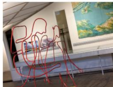
Impressie van de expositie 'Pelgrimage'